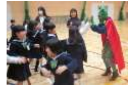
さかさマンとのハイタッチ