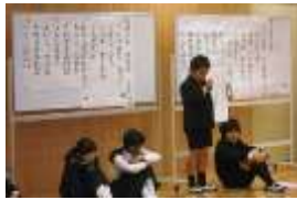
各学年のめあてを発表

子どもたちからこのテーマを提示された時、私は深く心が痛みました。一人一人が安心して楽しく過ごせない現実があることを子どもたちが感じていたからです。この一か月間、このテーマについて各学級で考えました。そしてみんなが心からの笑顔になれるよう具体的実践をしました。30日（月）には、その取組の成果や課題を発表し合います。見せる発表会ではなく、自分の心の在り様をじっくりと考える集会になることを期待します。時間の都合がつく方にご参観いただき、児童とともに人権について考えていただければと思います。