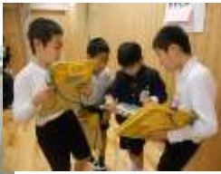
友だちいっぱい大作戦